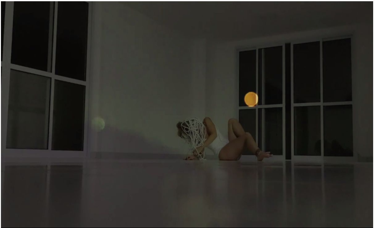
Figuras 2 e 3 - Frame Futuros Impuros , performance, 2021. 5