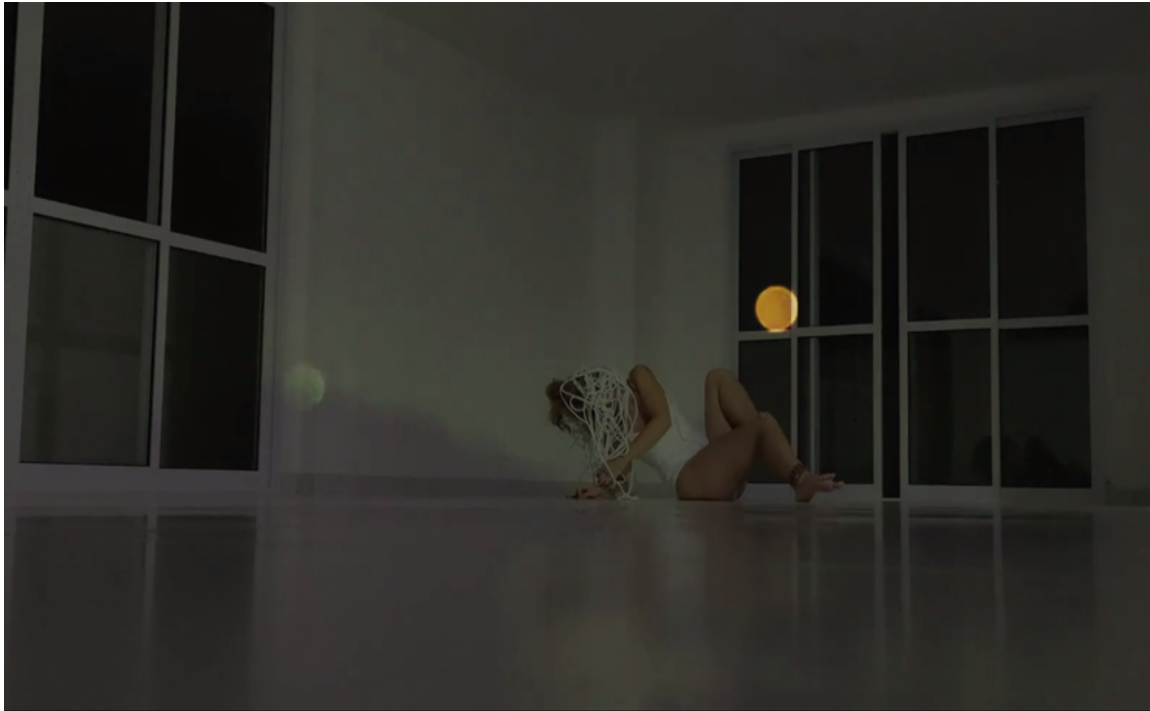
Figura 1 - Frame Futuros Impuros , performance, 2021. 4

Os movimentos dos corpos que ensejam e impulsionam relações à medida que seus territórios, atravessados pela experiência, constituem outros territórios, lançam-se às linhas de fuga onde se renovam os fluxos, trocas e transformações dos materiais e da sensibilidade em curso. Para Deleuze (1998) “linhas de fuga” estão a todo momento promovendo reterritorializações e desterritorializações dos mapas da experiência ou, como podemos aqui aproximar, da nossa estrutura embodied , arrastando-nos para o novo e para o que virá na imanência do processo. Se produz movimentos em direção ao desconhecido, o campo de força embodied tem a tendência a formar territórios, ou seja, a propor novas aberturas que podem descentralizar representações e comportamentos já dados. Nos processos artísticos, parece que lidamos a todo momento com essas potencialidades que têm como proposta a imprevisibilidade dos encontros e a saída do isolamento, os quais nos ligariam às multiplicidades dos rearranjos poéticos e de vida.